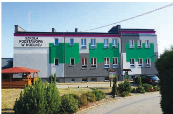
Termomodernizacja Szkoły Podstawowej w Modlnej