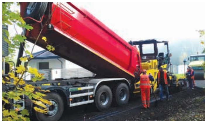
Przebudowa drogi gminnej nr 120122E w Sokolnikach

nowych punktów oświetlenia ulicznego, m.in. w Aleksandrii, Ostrowie, Sokolnikach-Lesie (ul. Narutowicza i ul. Literacka), Cedrowicach, Katarzynowie (ul. Jałowcowa), Sokolnikach (ul. Wrzosowa), Sierpowie.