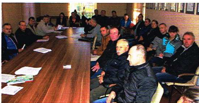
W listopadzie rolnicy z terenu gminy Ozorków wzięli udział w dwóch szkoleniach - z pracownikami ARiMR-u i KRUS-u.

wytycznymi wszyscy posiadacze zwierząt gospodarskich zobowiązani są do dokonania spisu zwierząt przebywających w siedzibie stada – co najmniej raz na dwanaście miesięcy, nie później jednak niż w dniu 31 grudnia. Posiadacz zwierząt jest zobowiązany do przekazania kierownikowi Biura Powiatowego ARiMR ich liczby oraz numerów identyfikacyjnych w terminie 7 dni od dnia