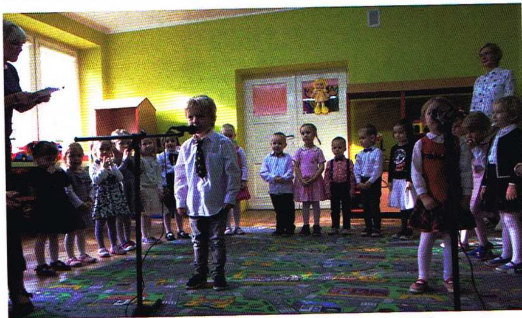
Podczas spotkania dzieci recytowały wiersze i śpiewały piosenki.