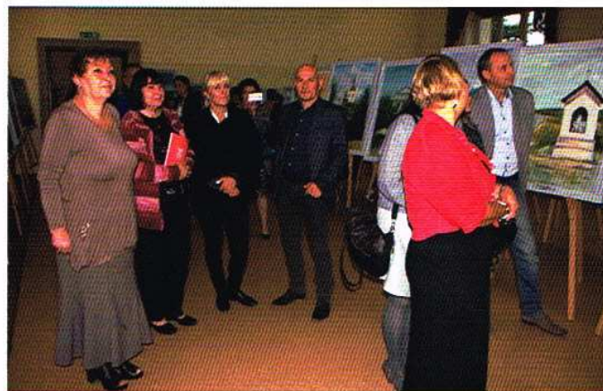
Poplenerowa wystawa cieszyła się dużym zainteresowaniem.