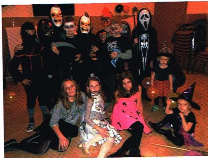
Uczestnicy „upiornej” imprezy.

Zorganizowane zajęcia służyły identyfikacji i integracji grupowej. Zabawy ruchowe natomiast miały na celu poprawę sprawności psycho-