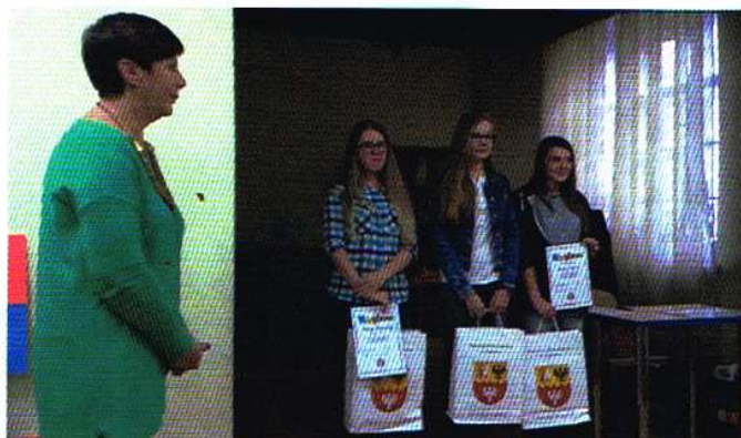
Laureatki konkursu ortograficznego