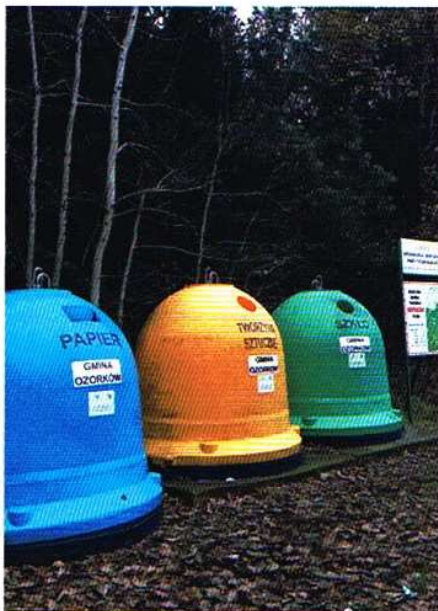
Wkrótce z terenu gminy Ozorków zniknie większość tzw. wysepki ekologicznych.

Jest to duże udogodnienie szczególnie dla starszych mieszkańców gminy Ozorków, ponieważ niekiedy kłopotliwe wywożenie odpadów typu papier, metal, tworzywa sztuczne, szkło, opakowania wielomateria-