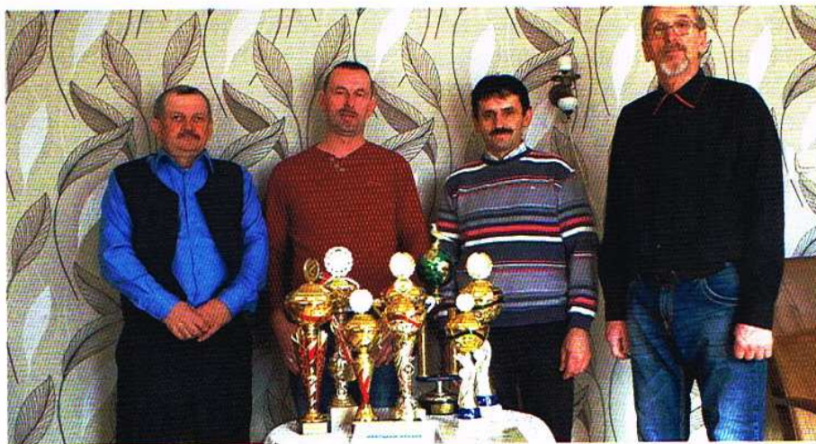
Na zdjęciu wyróżnieni hodowcy gołębi z sekcji Ozorków.