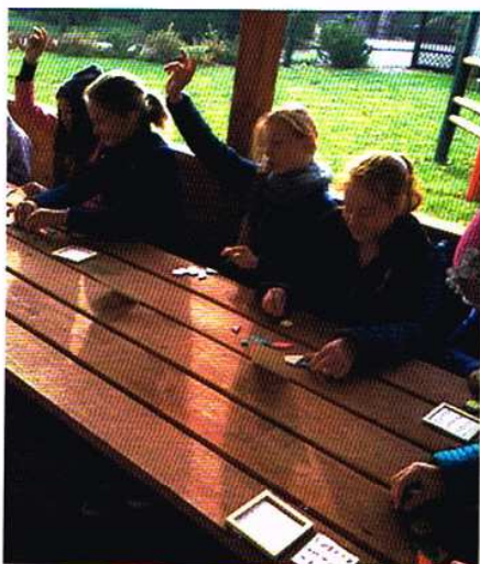
Podczas kolejnej gry terenowej uczestnicy zmierzali się z chińską łamigówką – tangram.