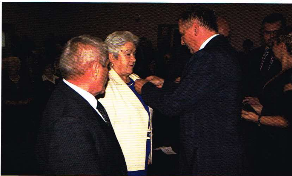
8 par z gminy Ozorków obchodziło jubileusz 50-lecia pożycia małżeńskiego

W sali Miejskiego Ośrodka Kultury w Ozorkowie świętowano w dniu 20 października br. jubileusz 50-lecia pożycia małżeńskiego. Z powodu imponująco dużej liczby jubilatów kierownictwo Urzędu Stanu Cywilnego w Ozorkowie zmuszone było przenieść tą doroczną uroczystość z siedziby USC do większego pomieszczenia.