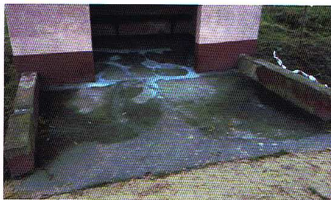
Nawierzchnia przystanku i sąsiadujący z nim przepust wymagały naprawy

Naprawy wymagało podłoże przystanku autobusowego w Konarach, które uległo kilku pęknięciom. Wykonania niezbędnych prac podjęli się pracownicy gospodarcy Urzędu Gminy Ozorków. Konieczna była również naprawa sąsiadującego z przystankiem przepustu podmytego przez wodę. Całość prac przebiegła bardzo sprawnie, nie utrudniając to okolicznym mieszkańcom korzystania z codziennej komunikacji autobusowej.