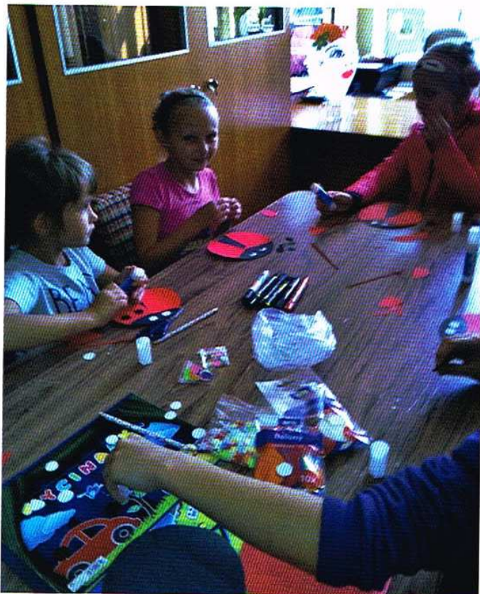
Zadaniem uczestników warsztatów było wykonanie prac związanych tematycznie z przeczytanymi rymowanekami.