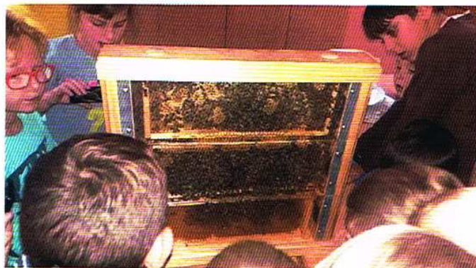
Największą atrakcją zajęć były żywe pszczoły.

W ostatnich dniach października w świetlicy w Parzycach i Małachowicach odbyły się imprezy halloweenowe. Przybyły na nie dzieci poprzebrane za stwory,