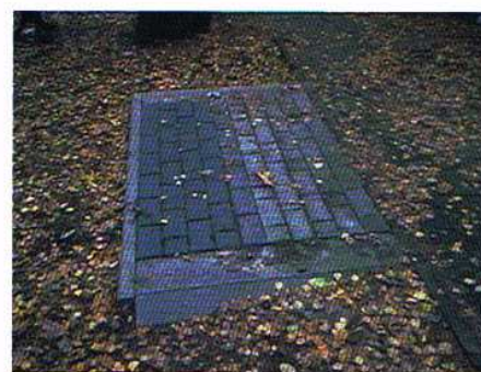
Na zdjęciu jedno z miejsc, w którym niedawno stała ławka skradziona przez złodziei.

- Dwie nowe ławki zostaną w najbliższym czasie zamontowane w miejscu skradzionych, ale nie będą to już ławki żeliwne. Skoro znajdują się one w kręgu zainteresowania mocno zdeterminowanych