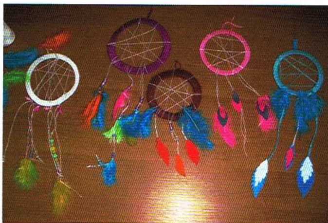
Dzieci wykonały indiańskie łapacze snów.

Agnieszka Tomczak, świetlica w Skromnicy oraz filia biblioteczna i świetlica w Pełczyskach