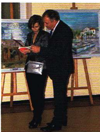
Gośćmi wystawy byli m.in. wójt gminy Ozorków oraz jego małżonka.