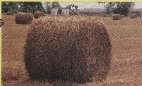
Żniwa już za nami