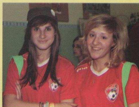
Półkolonie z ZMW w Zespole Szkół w Modłej