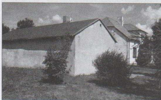
budynek Ośrodka Zdrowia w Solcy Wielkiej, w stanie surowym zamkniętym.

W roku bieżącym zgodnie z przedłożonym harmonogramem rzeczowo - finansowym zostanie wybudowany