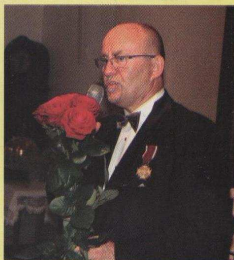
Uroczysty koncert XXIV MUZYCZNEGO LATA