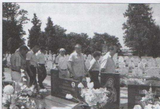
Radni byli na cmentarzu parafialnym w Modlniej i Solcy Wielkiej. Na cmentarzu w Modlniej spoczywa 142 żołnierzy Armii „Poznań” z 69 pułku piechoty. Polegli oni podczas dramatycznych i krwawych walk bitwy pod Kutnem. Na cmentarzu w Solcy Wielkiej znajduje się kwatery żołnierzy Wojska Polskiego poległych w 1939 roku.