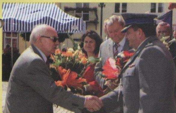
Wójt na święcie Policji