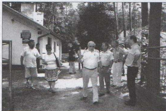
Rozbudowa hydroformy w Sokolnikach Lesie jest inwestycją postanowioną. Radni zapoznali się z faktyczną lokalizacją planowanej rozbudowy.

Już sokololnicanie mogą przemieszczać się ulicami o nowych nawierzchniach, położonych w tym roku na ulicy Marynarskiej i ulicy 22 Lipca. Dla jednych drogi powinny być o idealnej nawierzchni, a inni widzą konieczność pozostawienia miejscowości Sokolniki Las w nienaruszonym „leśnym” stanie. Jest to odwieczny problem tej miejscowości, poglądy się ścierają, argumenty obu stron są słuszne. W Sokolnikach radni zapoznali się z lokalizacją planowanych do budowy nowych miejsc parkingowych. Sokolniki Las, to miejscowość, która zachwyca swym urokiem. Wspaniały mikroklimat, czyste powietrze to walory tej spokojnej niewielkiej miejscowości. Zachęca zarówno do spacerów, jak i do wypoczynku, a sosnowy las doskonale nadaje się na spacer.