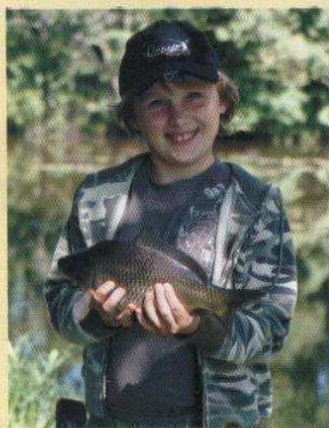
Zawody wędkarskie w Leśmierzu