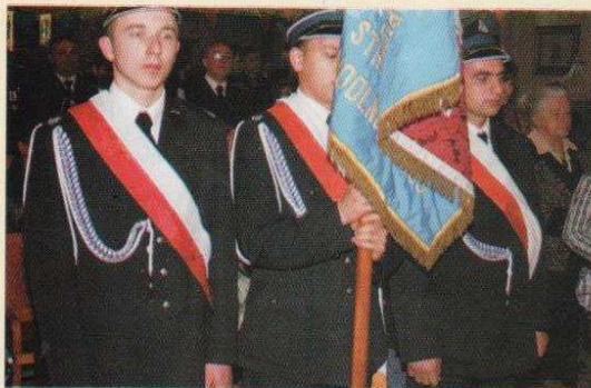
Święto strażaków w Modlnej