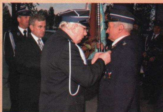
Święto Strażackie z Jubileuszem

Życzą Wójt i Rada Gminy Ozorków Redakcja