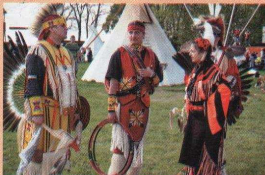
Festyn na Talance