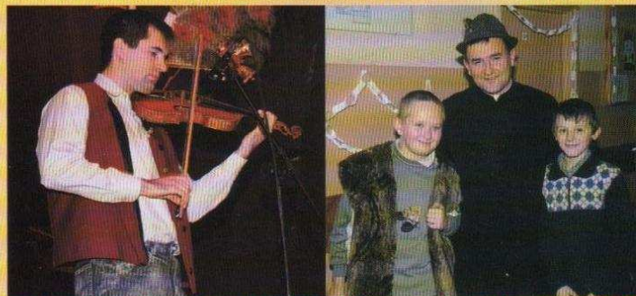
Wieczór Kolęd i Pastorałek Jaselka w Solcy Wielkiej

Zapraszamy miłych czytelników do kolejnego konkursu. Należy zbierać zamieszczane kupony.