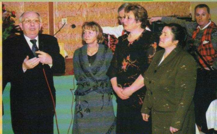
Jubileusz 40-lecia KGW w Sokolnikach Parceli