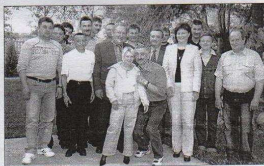
Strażacy jednostki Zakładowej Ochotniczej Straży Pożarnej przy Cukrowni w Leśmierzu podczas dorocznego spotkania z okazji obchodów św. Floriana.

Trzymamy się mocnej zasady, ażeby systematycznie w każdym budżecie na zadania inwestycyjne przeznaczać ponad 20% środków.