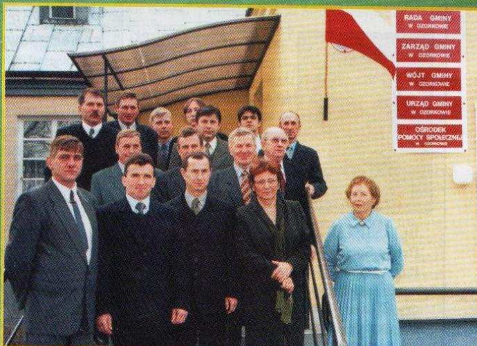
WŁADZE SAMORZĄDOWE GMINY OZORKÓW WYBRANE PRZEZ MIESZKAŃCÓW 27 X 2002 r.

8 grudnia 2002 roku odbędą się wybory do Rad Powiatowych Izby Rolniczej Województwa Łódzkiego Komisja Okręgowa Gminy Ozorków podjęła uchwałę w sprawie utworzenia jednego obwodu głosowania z siedzibą w Urzędzie Gminy w Ozorkowie, ul. Wigury 14 (sala konferencyjna). Głosować można w godz. 6 00 - 20 00 . Gminie Ozorków przysługują 2 mandaty.