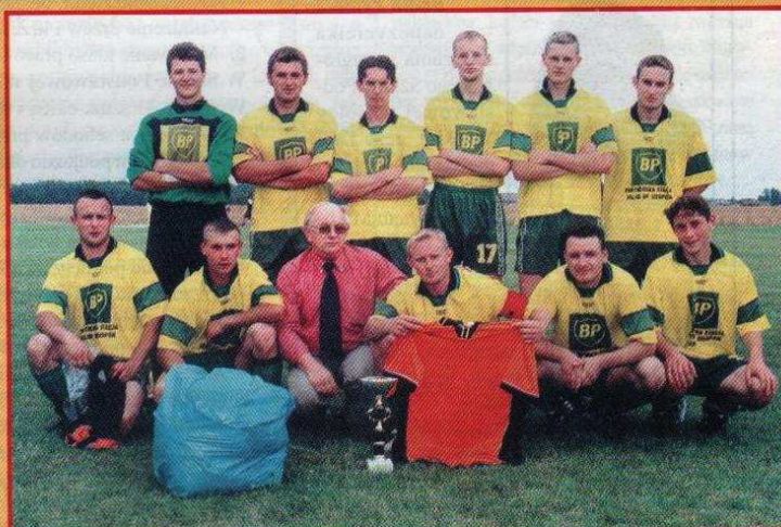
Drużyna MAGNAT Sierpów zdobyła Puchar Wójta Gminy Ozorków za 2002 r.

Do Urzędu Gminy w Ozorkowie docierają sygnały o domokrążcach (tzw. naciągaczach) oferujących naszym mieszkańcom różne usługi, narażające przy tym obywateli na poważne wydatki. Decydując się na oferowane "wynalazki", należy zasięgnąć fachowej opinii n/t celowości ich zastosowania. Działajmy rozważnie i nie dajmy się oszukać amatorom łatwego zysku.