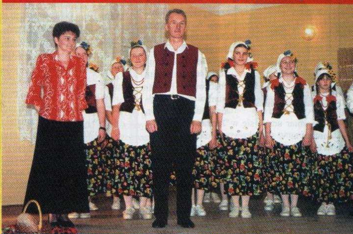
5. Iecie Młodzieżowego Zespołu Folklorystycznego z Modnej