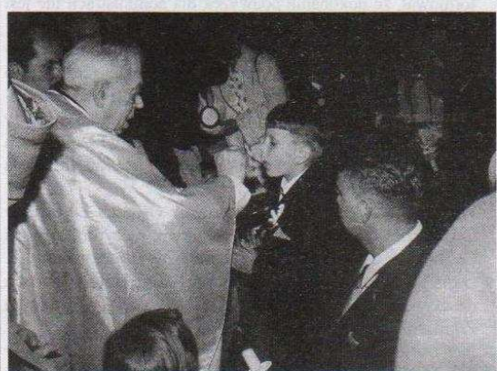
W miesiącu maju br. dzieci z klas II przystępowały do I komunii świętej. 19 maja taka uroczystość odbyła się w kościele w Leśmierzu, 26 maja w Sołcy Wielkiej i w Modlnej.