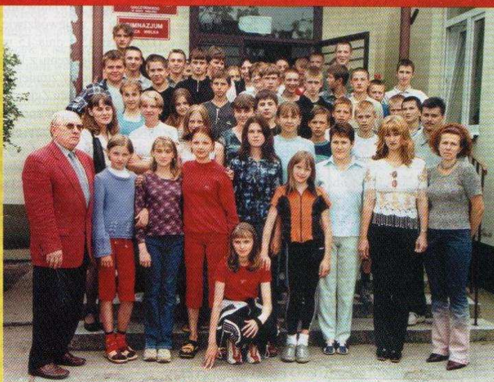
Polacy z Białorusi w Solcy Wielkiej