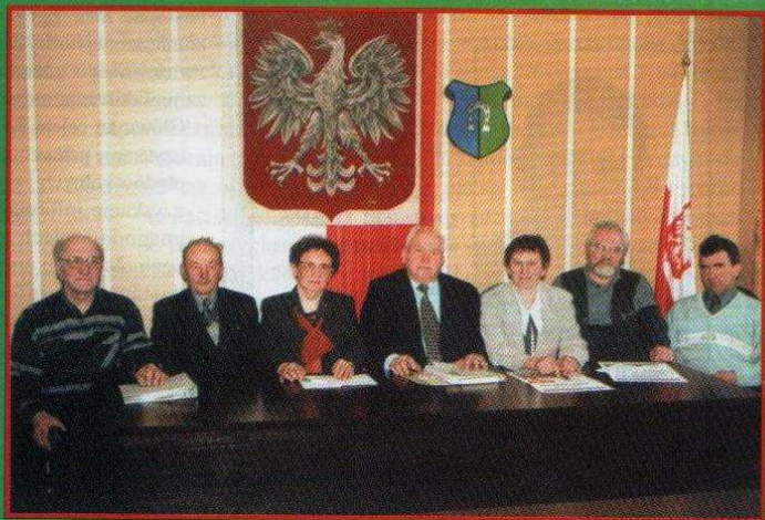
CO DALEJ Z GMINNĄ SPÓŁKĄ WODNĄ?