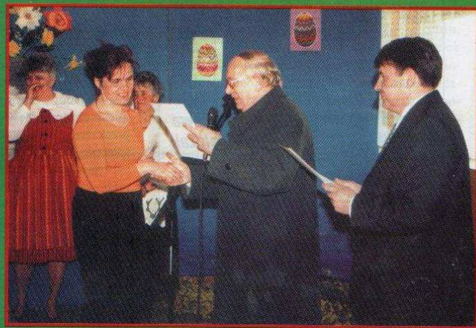
TRADYCJE WIELKANOCNE - Tymienica - 7 kwietnia 2002