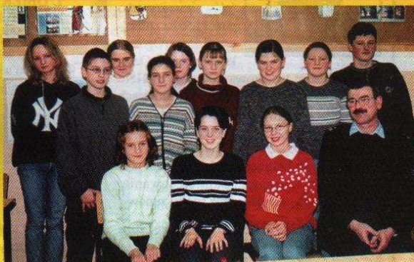
Grupa brydżystów z Gimnazjum w Leśmierzu

Zdrowych i Wesółych Świąt Wielkanocnych Wszystkim Mieszkańcom Gminy życzą Rada Gminy Ozorków Wójt Gminy z pracownikami Urzędu Redakcja "Gminniaka"