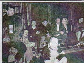
Wesolych Świąt Bożego Narodzenia oraz Szczęśliwego Nowego Roku Wszystkim Sportowcom Gminy Ozorków Życzy Rada Gminna LZS