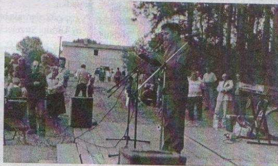
Kultury w Leśmierzu.

Dzień otwarcia boiska wyznaczono na 29 sierpnia br., co zbiegło się z inauguracją rundy jesiennej sezonu piłkarskiego 1999/