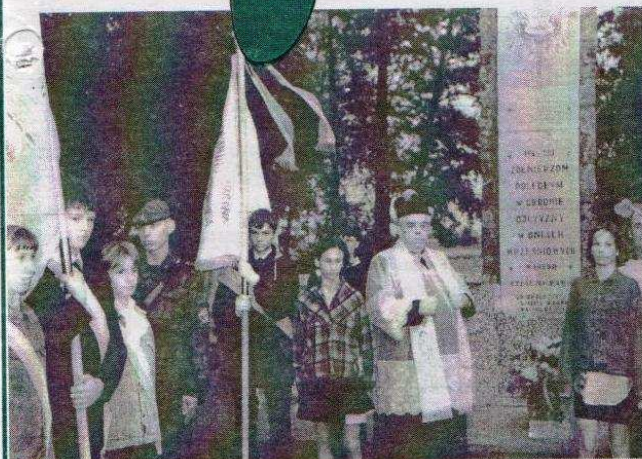
Obchody wrześniowych rocznic

Z okazji Gminnego Święta Plonów Wójt Gminy Ozorków składa wszystkim Rolnikom serdeczne podziękowania za ich trud włożony w tegoroczne żniwa, które ze względu na wyjątkowe warunki pogodowe były bardzo utrudnione.